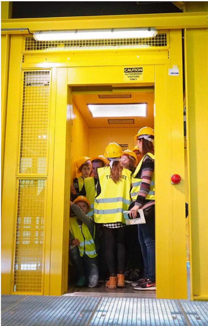
Opening Offshore Experience 2016